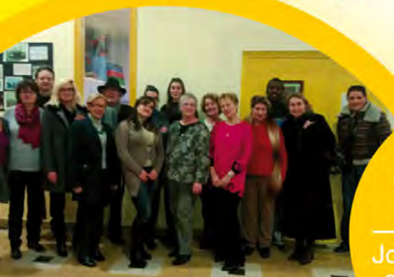
L'équipe de la Maison de la Prévention-Point Ecoute Jeunes

le droit d'en parler Parler c'est agir chercher et trouver des informations échanger se poser des questions